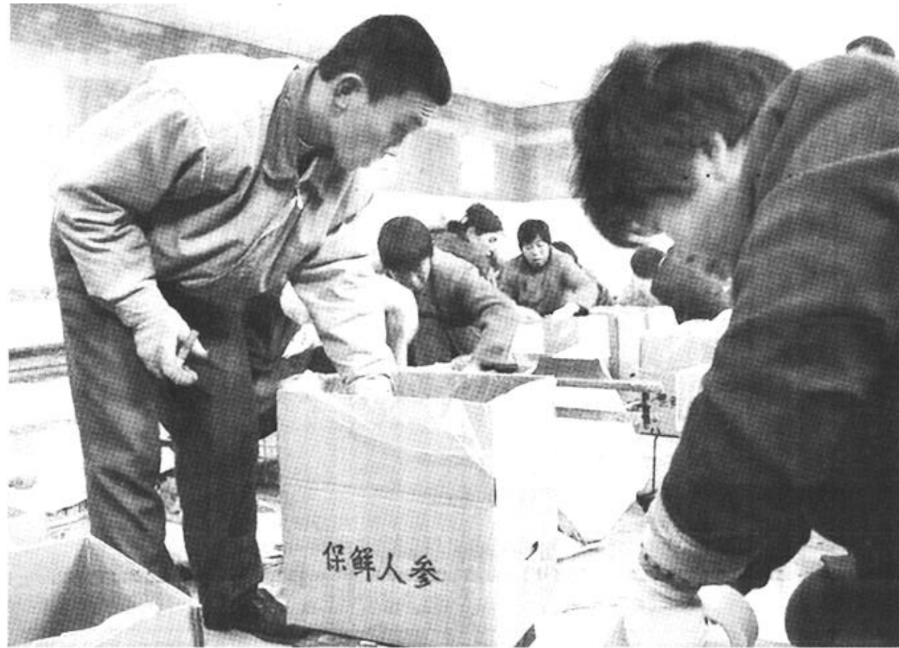
广饶镇大力发展蔬菜出口产业,种植的蔬菜已远销韩国、日本等国家,增加了当地农民的收入。图为该镇农民在进行蔬菜装箱外运。

该街道企业不断加大科技投入,进一步提高产品质量。同时还加强了信誉建设,牢固树立信誉第一的经营理念。他们依靠过硬的产品质量,良好的信誉优势,不仅赢得了全国各地消费者的青睐,而且还将产品打入了国际市场,产品远销到美国、意大利、瑞典等欧美国家。(岳建美)