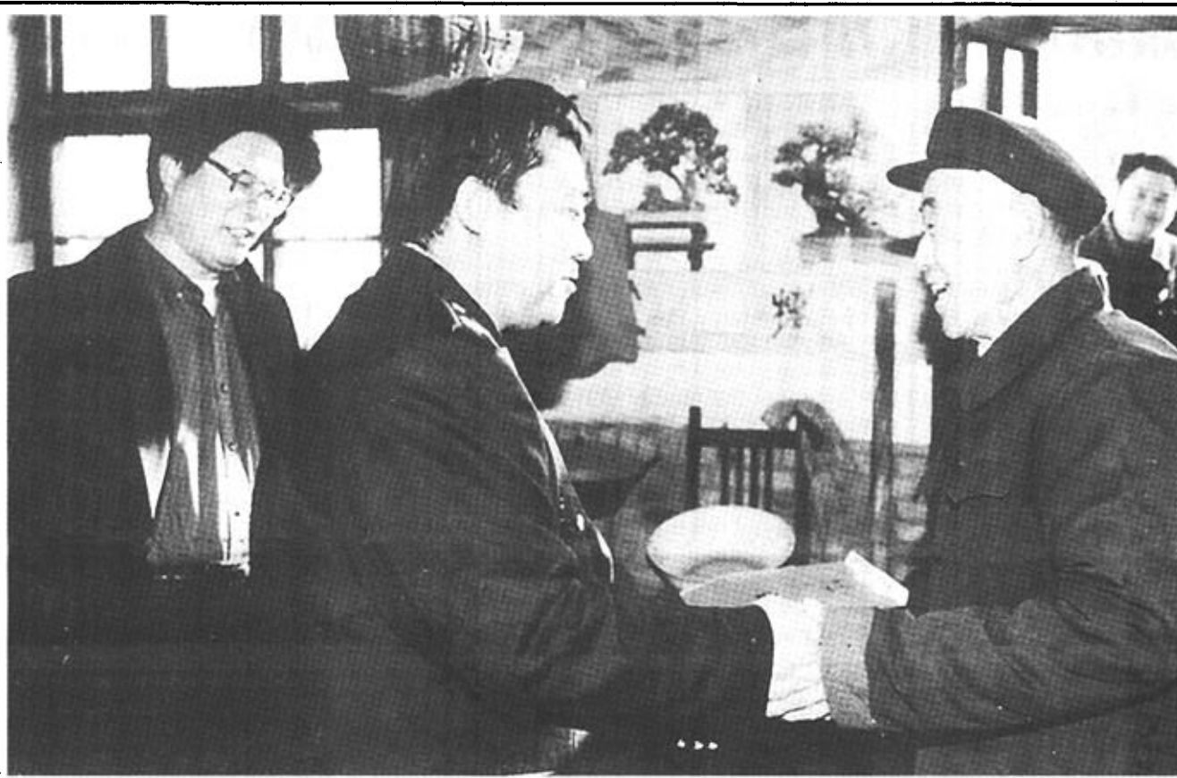
市地税局驻利津县汀罗镇陈家村包村工作组，在认真做好对该村经济发展工作的同时，近日，又筹集资金对该村的贫困户进行了走访慰问...