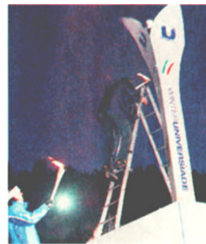
1月16日，意大利体坛名将巴卢奇(左)在塔林举行的第21届世界大学生冬季运动会开幕式上点火，因技术故障未能成功，旁边工作人员急中生智搬来梯子，爬上去点燃了主火炬。

根据赛程，这次超霸杯赛将不再采取主客场两回合赛制，而是一场比赛定胜负，比赛安排在中立城市进行。因此，这使比赛更加充满悬念，并将成为江城球迷春节期间的一大盛事。(李鹏翔)