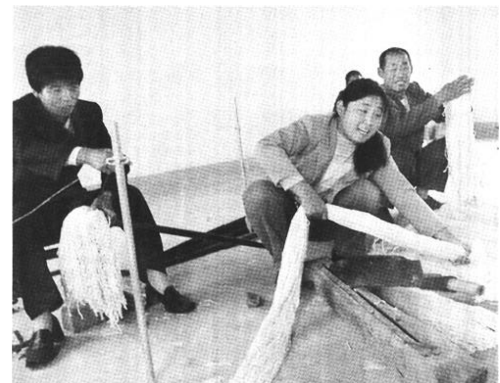
市人民检察院驻东营区牛庄镇里村包村工作组积极扶持村民发展经济,帮助增加农民收入。自进村以来,他们先后协调资金帮助村里建起了养虾场、拖把厂等,为村民增收奠定了基础。