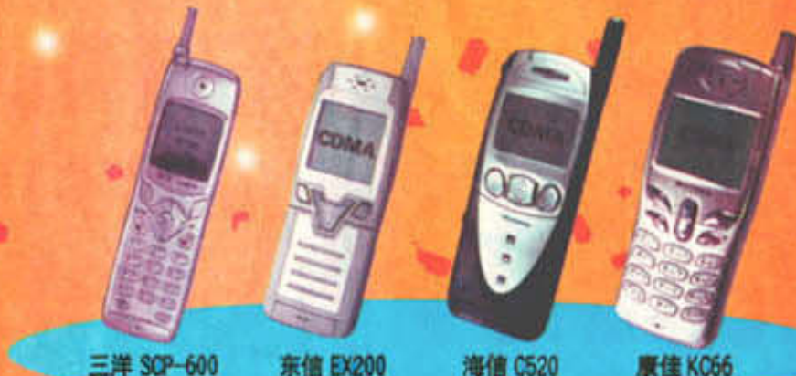
三洋 SCP-600 东信 EX200 海信 C520 康佳 KC66

◆移动多媒体应用——可实时彩色图像、动画片段传输、视频点播、航空订票预定、流行市拍信息、电子行情、电子宠物以及丰富多彩的网络游戏